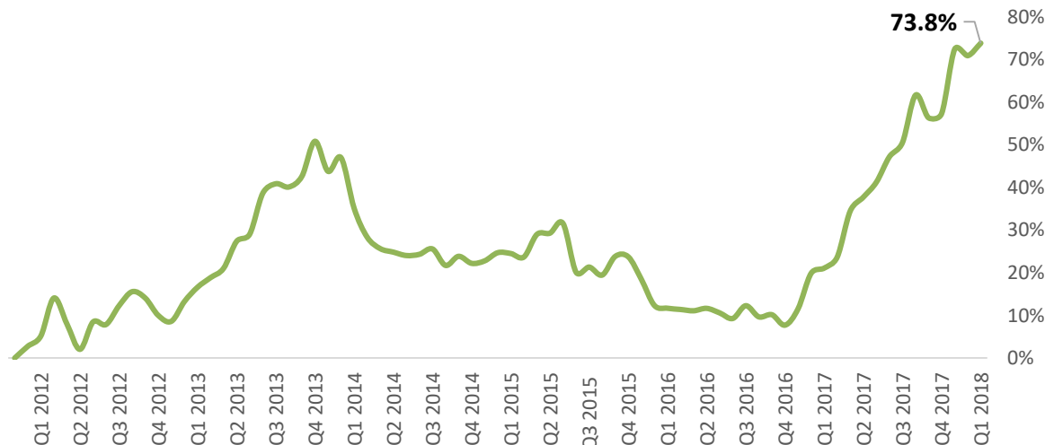
Vývoj stratégie v USD

■ Technológie ■ Finančné služby ■ Zdravotníctvo ■ Hotovosť